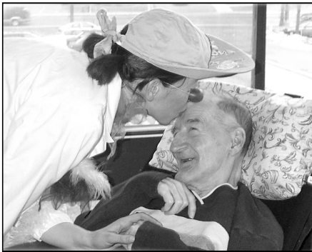
Dr Fifi se pense bien

« Il ne s'agit pas de jouer un personnage mais de se laisser posséder par un double : l'enfant qui sommeille en nous »