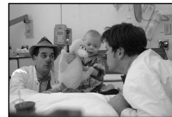
Dr L'Air de rien et Dr Spring

L'absence de perspective d'avenir de l'enfant n'empêche pas de nourrir son désir d'apprendre, de jouer et de créer.