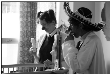
Dr Fifi et Dr Guacamole